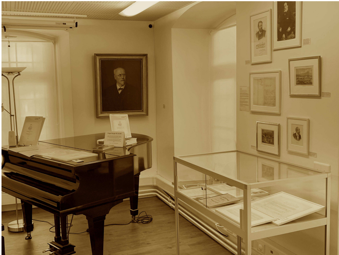
Blick ins Joachim-Raff-Archiv am Seeplatz 1 in Lachen.

Am musikwissenschaftlichen Symposium, zu dem namhafte Forschende aus der Schweiz und Deutschland eingeladen sind, werden verschiedene Aspekte von Raffs vielseitigem Schaffen aus neuen Perspektiven beleuchtet. Raff präsentiert sich als scharfsinniger Zeitgenosse nicht nur des musikalischen, sondern auch des gesellschaftlichen Lebens; «Tiefblicke» beleuchten bisher wenig bekannte oder untersuchte Werke des Lachner Komponisten. «Lebenswelten», in denen Raff wirkte, erhalten schärfere Umrisse, und zwei Referate beleuchten Raffs Nachleben nach seinem Tod.