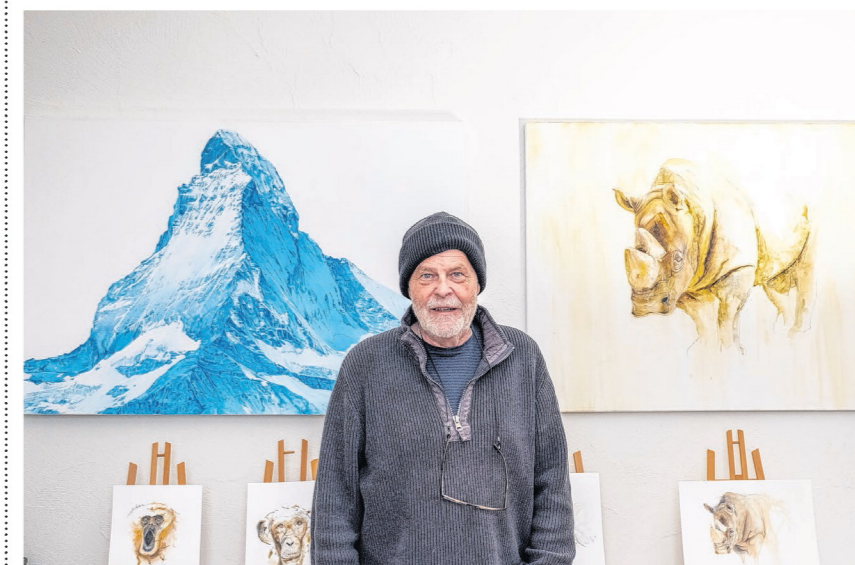
Text / Bild Michel Wassner

Ins offene Gartenatelier in Buttikon lud Irene Wyrsch. Sie arbeitet auf Leinwand, Papier und Holz. Für sie ist das Schwyzer Kulturwochenende essenziell. «Gerade für unbekanntere Künstler ist es eine wichtige Möglichkeit, ihre Werke zu zeigen.» Sie ist zum zweiten Mal dabei.